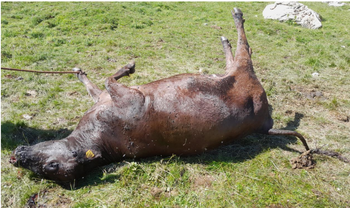
Abbildung 2: Durch Wölfe des Beverinrudels im Juli 2022 gerissene Mutterkuh.

Drei männliche Wölfe (M225, F112, M275) wurden auf der A13 zwischen Chur und Maienfeld überfahren.